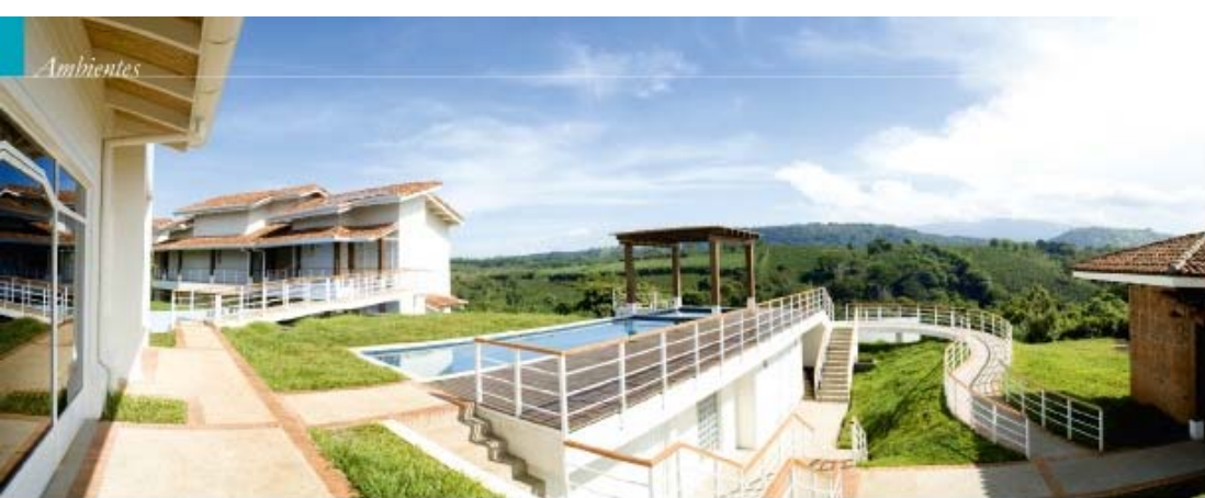
Por: Mariana Apóstegui Pinto